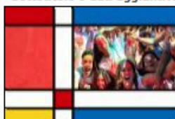
Immagine 1 (quella maggiormente rappresentativa)